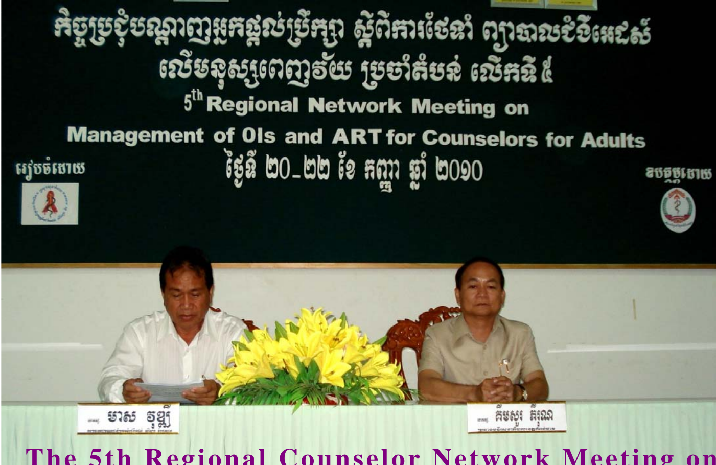
The 5th Regional Counselor Network Meeting on Management for OIs and ART for Adults KCH , 20 - 22 September 2010